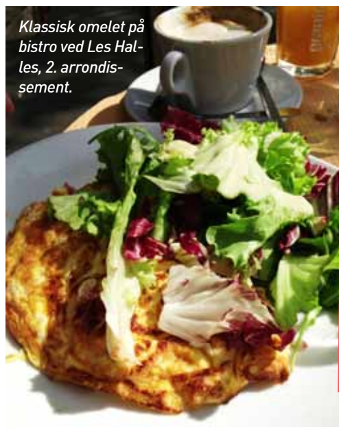
Klassisk omelet på bistro ved Les Halles, 2. arrondissement.