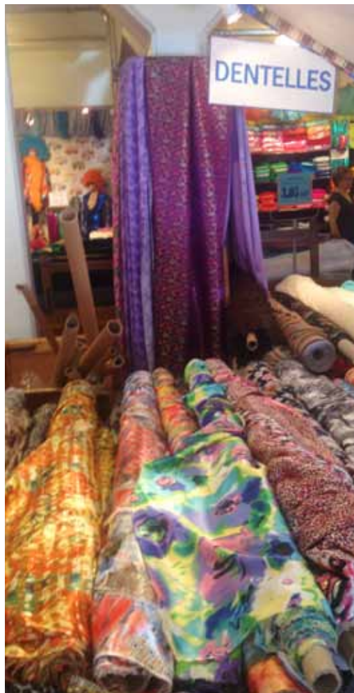
Marché Saint-Pierre, 2 rue Charles Nodier, 18. arrondissement.