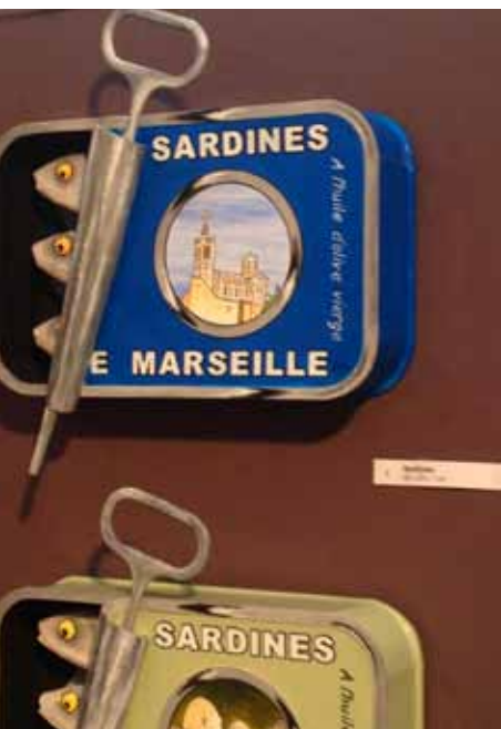
Canal Saint-Martin markedet ved Bastillepladsen. Blikkunst er meget, meget moderne. 12. arrondissement.

Man kan selvfølgelig få alt i en stor by som Paris. Men hvis du er som folk er flest, så falder du nok særligt for denne her butik med miniaturreting til dukkehuse. Den er kæmpestor, og den har ALT: små bananfæde, håndtag til skabe, ALT. Og så ligger den inde i en af disse hemmelige, overdækkede butiksarkader, som Paris er fuld af.